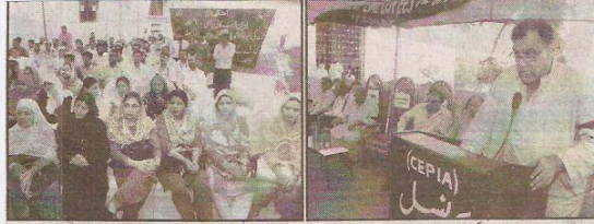
سچیما کے رہنما شہل کی ایئر لائن کو پروازوں کی اجازت دینے کیخلاف مظاہرے سے خطاب کر رہے ہیں

شہل کی ایئر لائن کو پروازوں کی اجازت دینے کیخلاف سچیما کا مظاہرہ کراچی (انساف رپورٹ) نی آئی اے ملازمین کی کونسل سچیما کے تحت ہوا گیا ہے۔